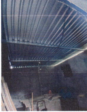
Foto 1: Sustitución de estructura de soporte de madera, por metal