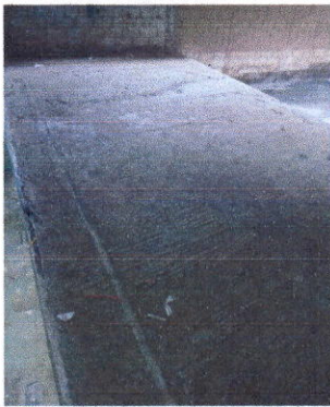
Foto 3: Sustitución de piso cerámico por adoquín en escenario de salón y sustitución de piso de torta de concreto en salón