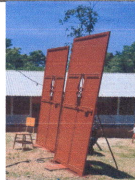
Foto 6: Mantenimiento a estructura (lijado, cambio de tubo, cepillado, sujeciones, aplicación de pintura)

Observación: Si es necesario se pueden agregar hojas adicionales y actualizar el número de hojas.